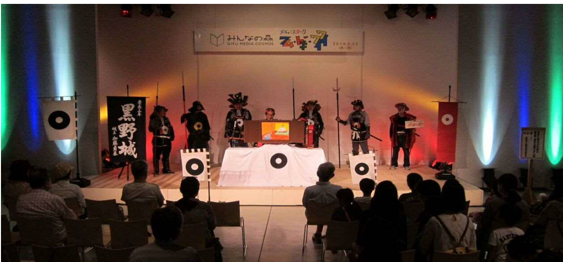
ぎふメディアコスモス・秋のまつりに初出展 紙芝居「黒野のお殿さま」を上演

本号も前号に引き続き、黒野城にまつわるお話や、当研究会の活動状況などをお伝えします。