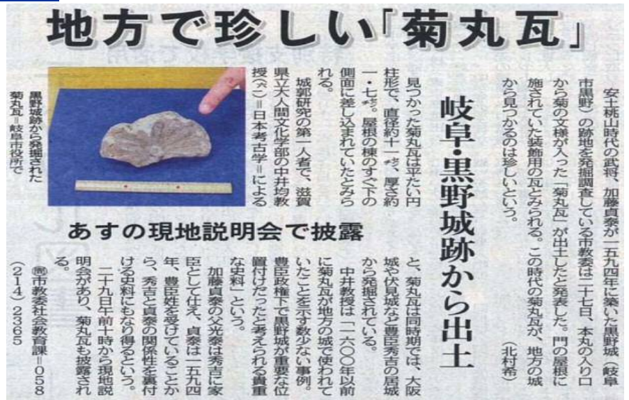
2016. 10. 28 中日新聞より

岐阜市教育委員会による平成28年度(第4次)黒野城跡・本丸の発掘調査で、菊丸瓦が出土しました！