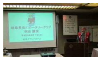
岐阜長良川ロータリー クラブ講演会