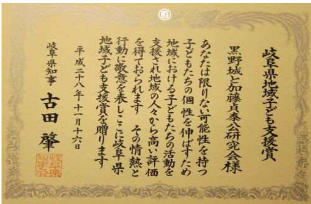
2016. 11. 16 県図書館に於いて受賞

平成25年5月から黒野小学校の児童を対象に「ふるさと子ども検定」を行ない、歴史学習を支援してきた活動が評価・推薦されて団体の部で受賞しました。