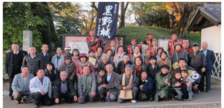
2016. 11. 16 黒野城本丸跡にて

愛媛県大洲市の曹溪院一行30名が観光バスで黒野城跡に來訪されました。曹溪院は臨濟宗妙心寺派、加藤貞泰が父光泰のために創建した加藤家菩提寺。岐阜と大洲は400年の歴史の中で繋がるゆかりの地。短い時間ながらも交流を深め、皆さま喜んでお帰りになりました。