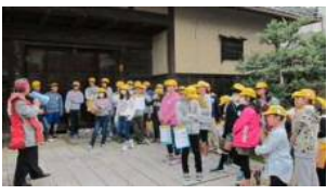
黒野小フィールドワーク