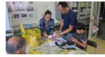
鎧・兜手作り教室 (上・右共に)