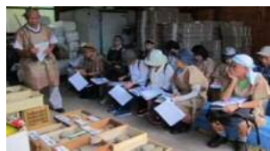
長良川おんぼく2016 梨の食べ比べ& 鶺鴒山ふもと巡り