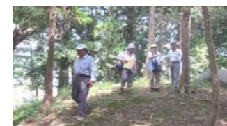
全国城郭研究セミナーの 先生が黒野城下町見学