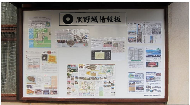
「黒野城情報板」の設置