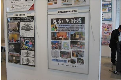
NPOパネル展に参加 (岐阜メディアコスモス)