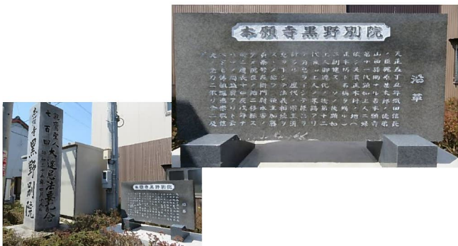
本願寺・黒野別院跡に甦った石碑

早速、ラミネート加工した岐阜市教育委員会の発掘報告や活動資料を掲示しました。城跡を訪れる人に黒野城の知識や研究会の活動を知ってもらえるものと思います。