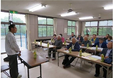
七郷「ふるさと歴史文化講座」 (黒野会館分館)