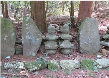
遺跡・史蹟めぐり 安藤守就墓(網代地区)