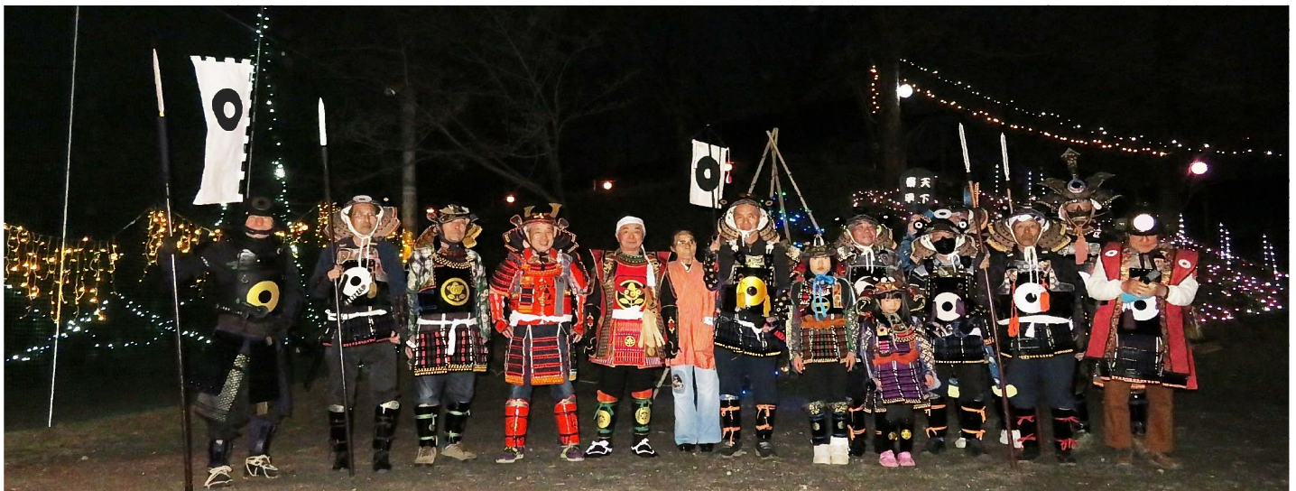
「黒野城武将隊勢揃い」 黒野城跡公園イルミネーションにて