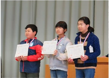
平成28年度ふるさと 子供検定表彰(黒野小学校)