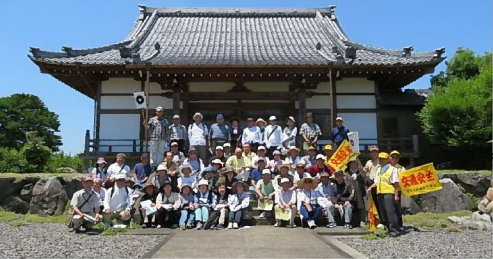
第4回黒野歴史探訪 古市場・今川・交人の史跡巡り