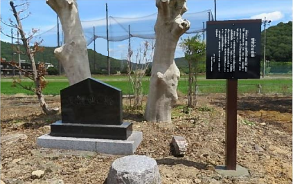
交人の「喧嘩松跡の由来」 樹木剪定後、案内板設置