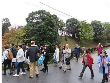
長良川おんぱく2017 黒野城&富有柿