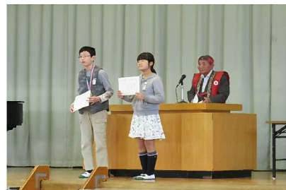
「黒野ふるさと検定」表彰式