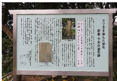
連句碑案内板(新設)