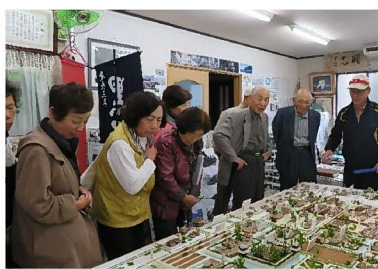
加藤貞泰弟・平内(旗本)の知行地 池田郡六之井一行案内