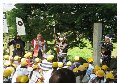
黒野小ふるさと学習 6年生100名参加