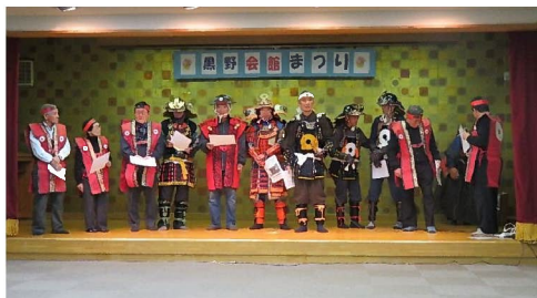
黒野会館まつり 黒野城下町賛歌 舞台発表