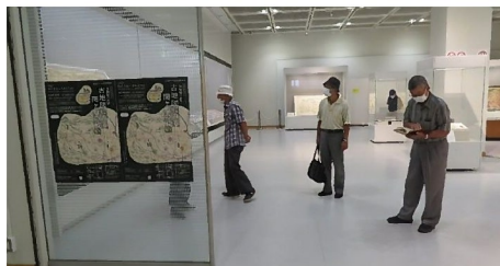
岐阜県図書館「古地図にみる関ヶ原の戦い」を見学