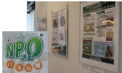
メディアコスモス「NPO活動パネル展」に出席