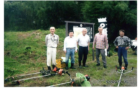
黒野城搦手側土塁・外堀の草刈り