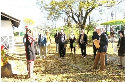
揖斐「ふるさと歴史講座」一行来訪