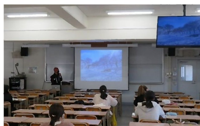
岐阜大学にて「黒野城のまちづくり」講師