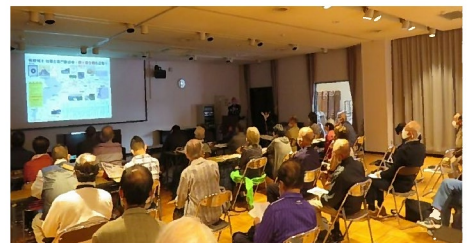
安八町で河川と黒野領主の関わりを講演