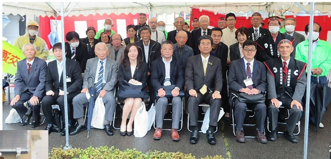
案内板除幕式の参加者

明治維新～昭和初期に日本の経済界に大きな足跡を残した両氏を顕彰し、黒野のご当地に生誕地標柱と案内板を設置することで、彼らの多大な功績を広く世間に知っていただくとともに、郷土の活性化のきっかけになればとの願いを込めて設置されました。