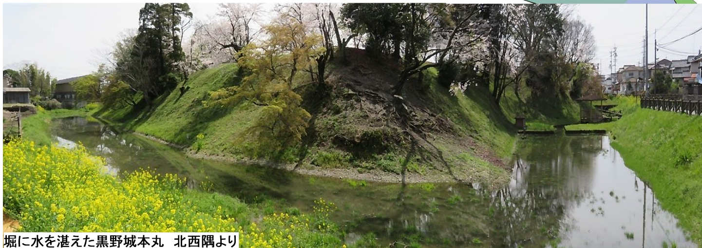
堀に水を湛えた黒野城本丸 北西隅より