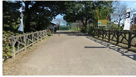
黒野城跡・入口に駐車場(公園課整備)