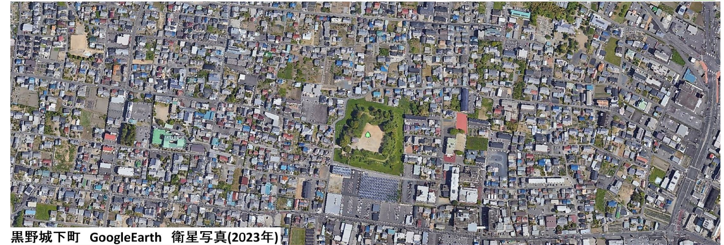
黒野城下町 GoogleEarth 衛星写真(2023年)