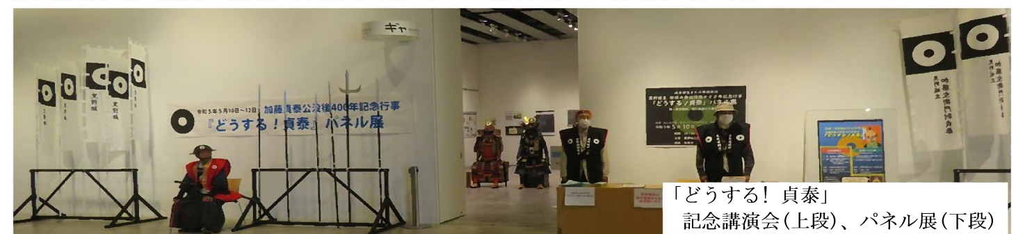
「どうする! 貞泰」 記念講演会(上段)、パネル展(下段)